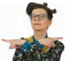
21.+22.09.2024 Frieda Braun: Auf ganzer Linie