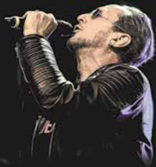
25.05.2024 Weitersagen! feiert... 75 Jahre Westernhagen