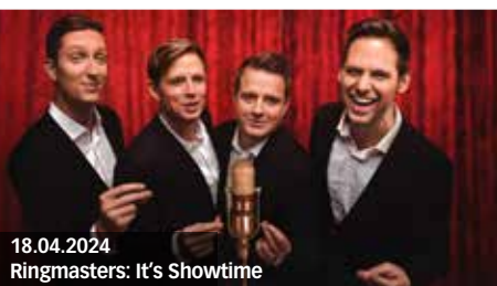
18.04.2024 Ringmasters: It's Showtime